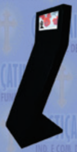
Painel Informativo com monitor

(18) 3623.5734 - 3625.2496 Rua dos Buritis, 127 - Araçatuba/SP - 16012-170 casticaisaracatuba@terra.com.br