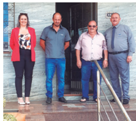
Estrela, de Estação