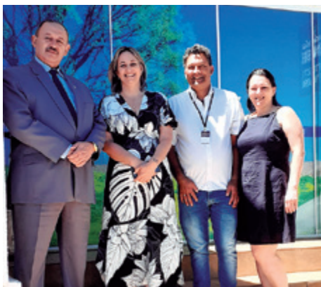
Urtiguense, de São João da Urtiga