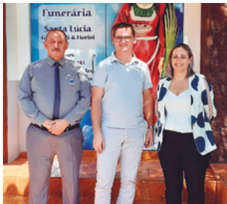
Santa Lúcia, de Severiano de Almeida