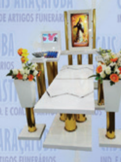
Capela Santa Fé com dois monitores