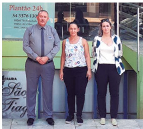
São Tiago, de Aratiba