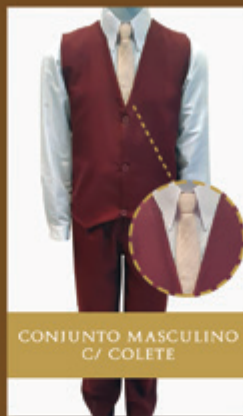
CONJUNTO MASCULINO C/ COLETE