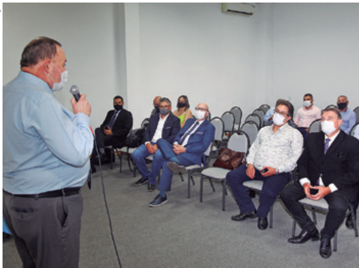
Eleição se deu por aclamação. Mandato vai até 2026