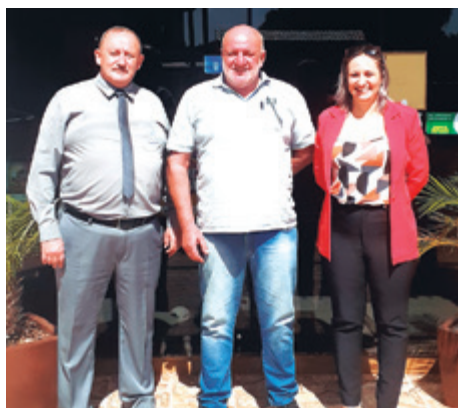
Bocalon, de Sertão