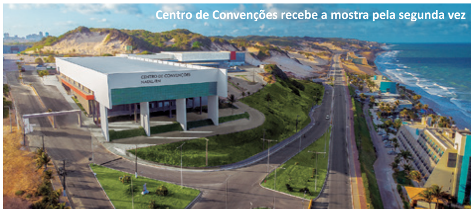
Centro de Convenções recebe a mostra pela segunda vez

Nesta edição, o tema do evento é Um Sonho de Esperança. No site, é possível conferir a