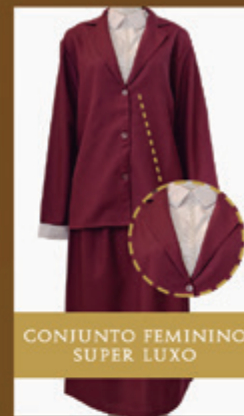
CONJUNTO FEMININO SUPER LUXO