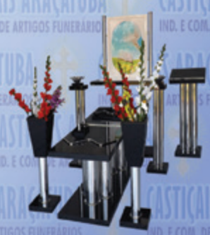
Capela Santa Fé com painel giratório

Visite nosso site: www.casticaisaracatuba.com.br