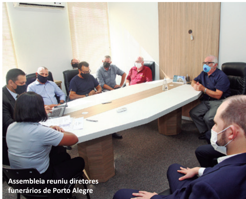
Assembleia reuniu diretores funerários de Porto Alegre