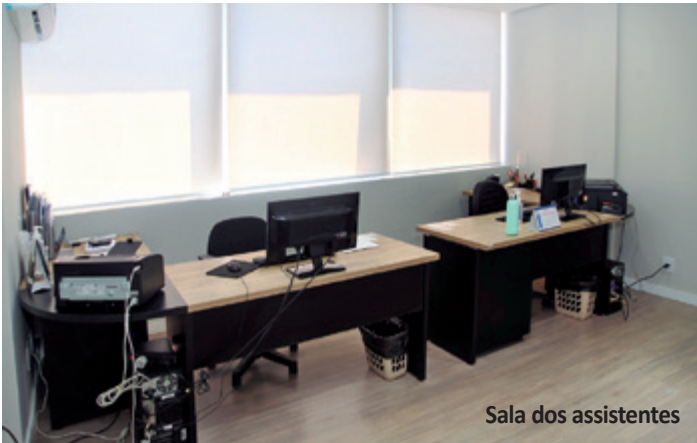
Sala dos assistentes