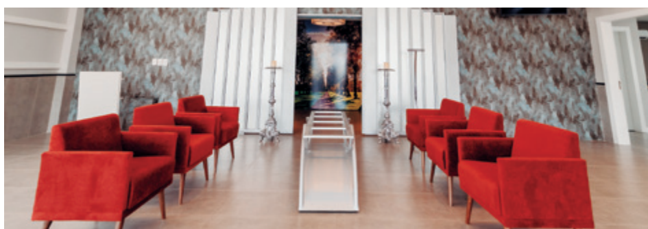
Complexo apresenta três salas para velório e cerimonial de despedida

De acordo com o grupo, o investimento em adequações e melhorias no Parque da Memória foi superior a R$ 6 milhões. Além do crematório, também foram entregues três salas para velório e cerimonial de despedida, o que equivale a mais 1.200m 2 de área construída. A projeção é de atender mais de 40 municípios