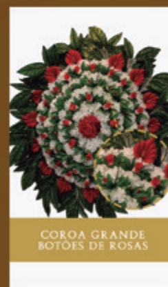
COROA GRANDE BOTOES DE ROSAS