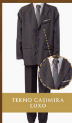
TERNO CASIMIRA LUXO