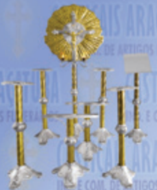
Jogo 07 Superluxo

Visite nosso site: www.casticaisaracatuba.com.br