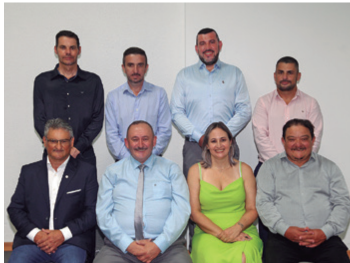
Nova diretoria toma posse no dia 2 de abril