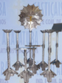
Jogo 011 Luxo