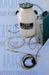
Bomba a Vácuo