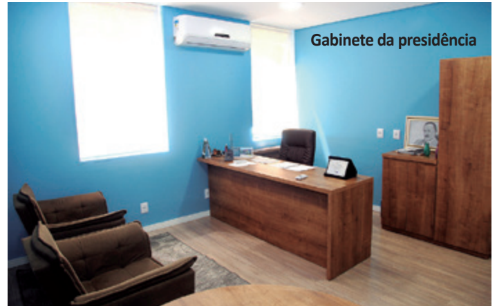
Gabinete da presidência