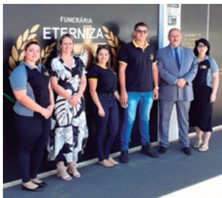
Eterniza, de Machadinho