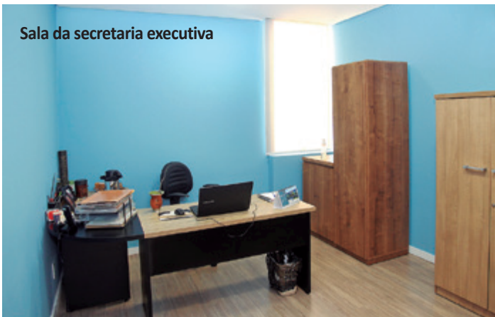
Sala da secretaria executiva