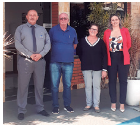
Santo Expedito, de Erechim