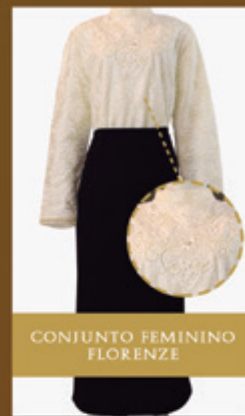
CONJUNTO FEMININO FLORENZE