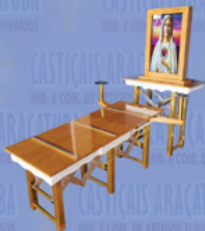
Capela Portátil Laminada em Madeira com monitor de 32"