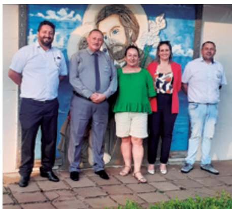
São José, de Erechim