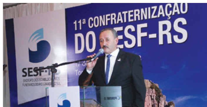
Presidente: "O Sef-RS é uma grande família"