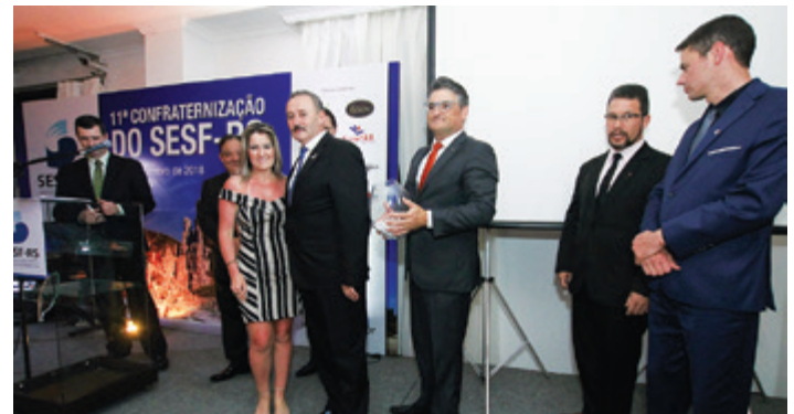
Sorteio premiou convidados com artigos funerários, equipamentos e até mesmo uma viagem