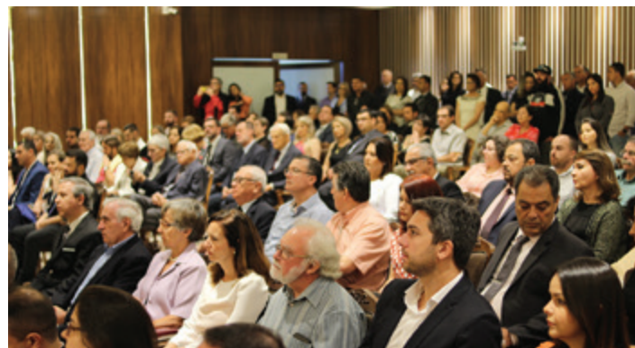
Convidados lotaram o salão nobre