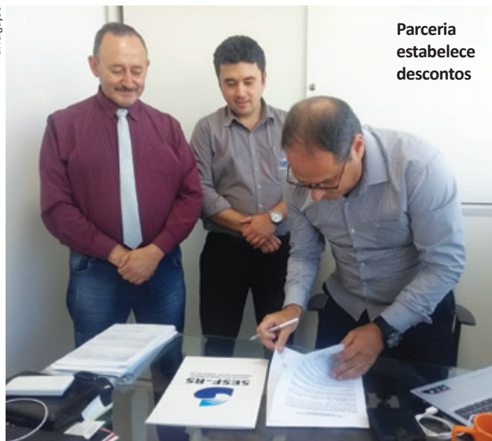
Parceria estabelece descontos