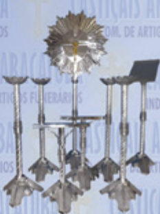
Jogo 011 Luxo