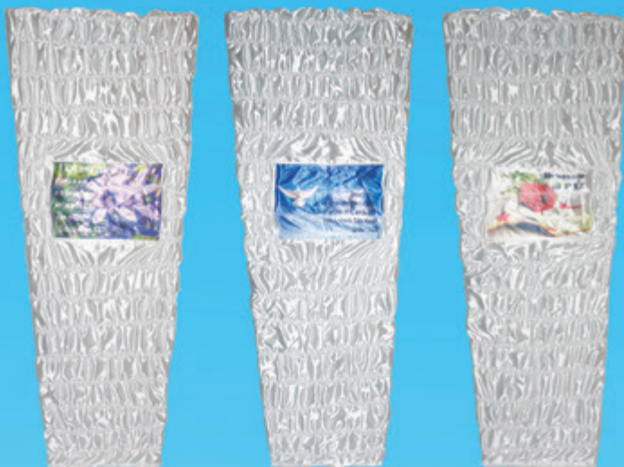
Mantos de Cetim