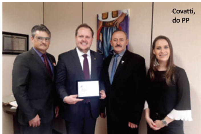
Covatti, do PP