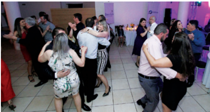
Público dançou e se divertiu com a música ao vivo