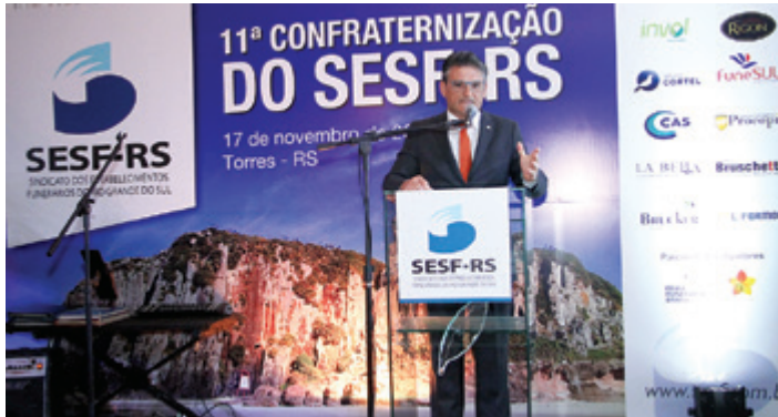
Claunei, vice: “Nosso sindicato é muito respeitado em todo o país”