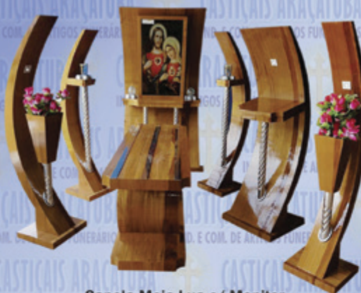
Capela Meia-Lua c/ Monitor