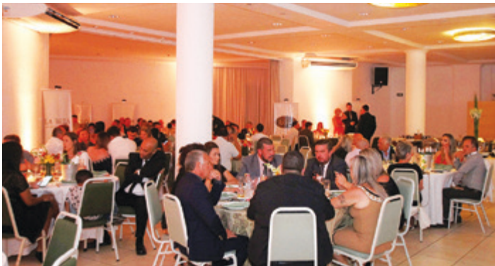
Mais de 200 convidados participaram do jantar