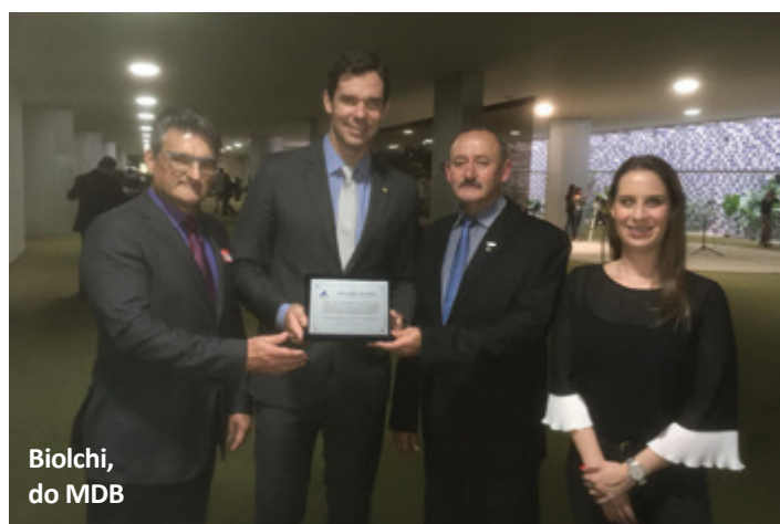
Biolchi, do MDB