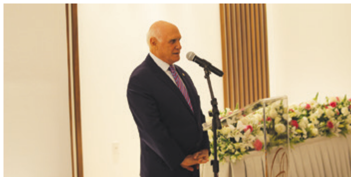
Lasier Martins, senador: “Temos orgulho de ter um empreendimento desta qualidade numa cidade que já tem tantas coisas boas”