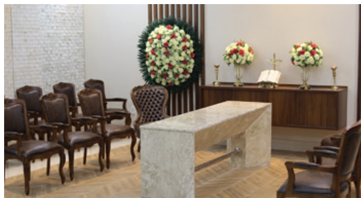
Capelas para velório: amplas e climatizadas