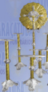
Jogo 07 Super Luxo

Visite nosso site: www.casticaisaracatuba.com.br