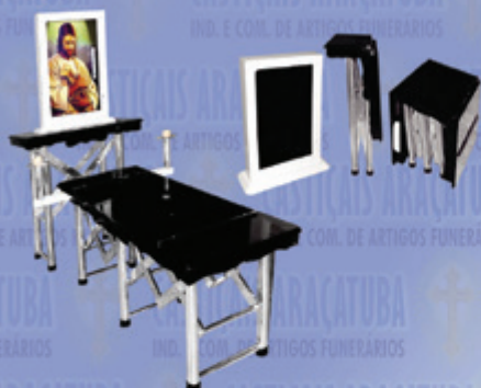
Capela Portátil c/ Monitor

PRESEÇA CONFIRMADA na Exponaf 2019 29 a 31 de maio | Expo Dom Pedro | Campinas/SP