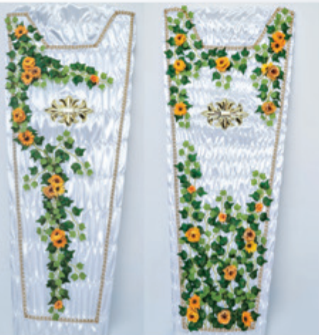
NOVIDADE! Edredons Flor-de-Lis

Trata-se de um vestido de luxo que foi batizado com esse nome por vestir pessoas muito importantes, que ocuparam um espaço único na vida e nos sentimentos das pessoas.