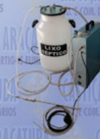
Bomba Dupla Função