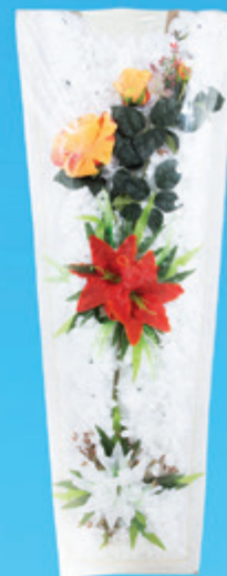
Mantos de Flores