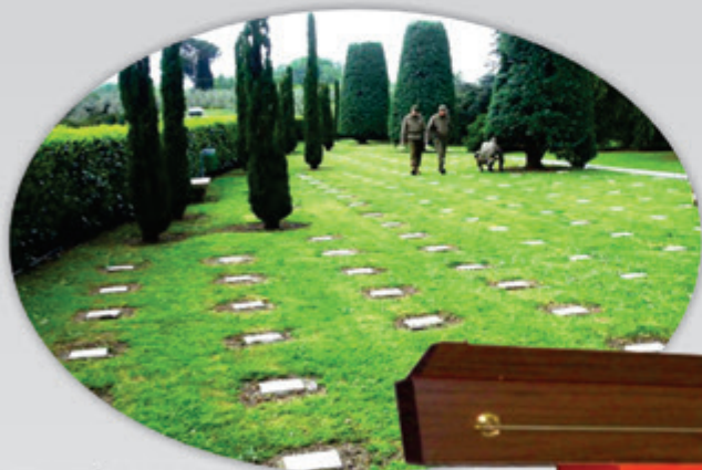
CEMITÉRIO DOS PRACINHAS BRASILEIROS PISTÓIA - ITÁLIA