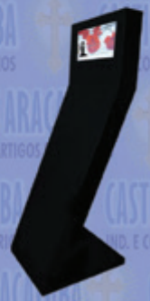
Painel Informativo c/ Monitor