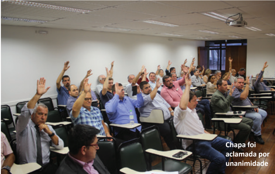
Chapa foi aclamada por unanimidade