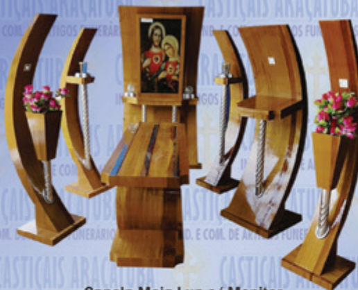
Capela Meia-Lua c/ Monitor Lançamento 2017