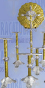
Jogo 07 Super Luxo

Visite nosso site: www.casticaisaracatuba.com.br