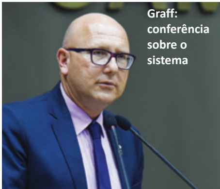
Graff: conferência sobre o sistema