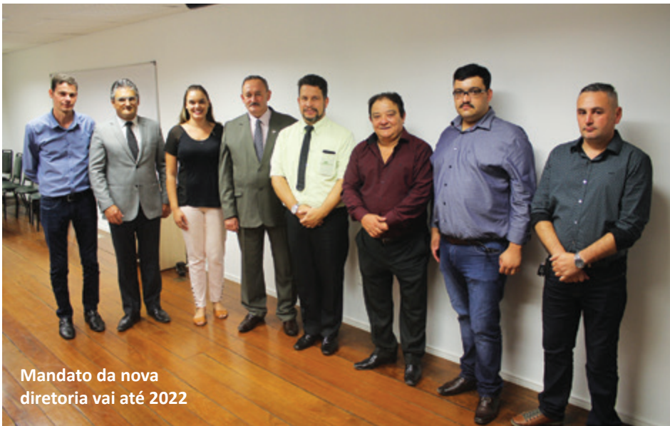
Mandato da nova diretoria vai até 2022