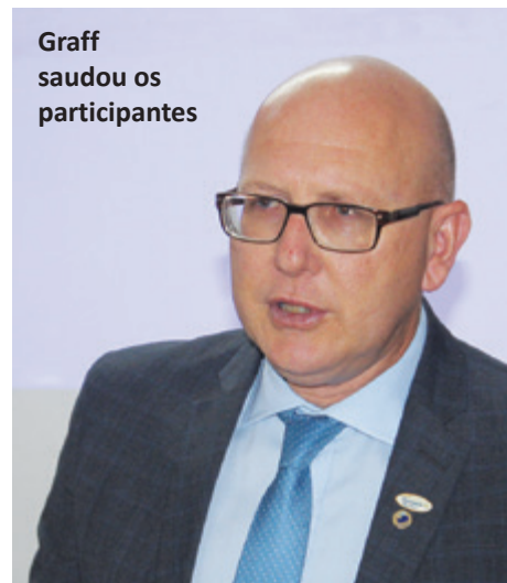
Graff saudou os participantes