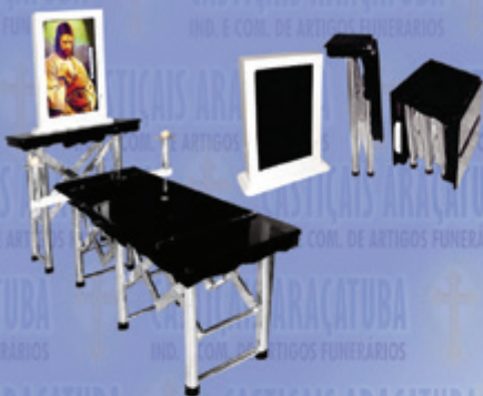
Capela Portátil c/ Monitor