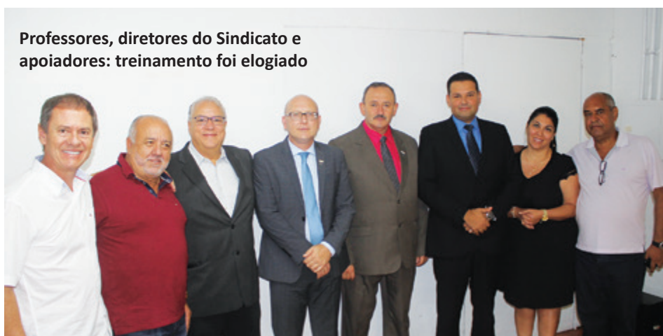
Professores, diretores do Sindicato e apoiadores: treinamento foi elogiado