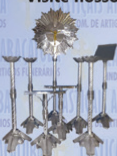
Jogo 011 Luxo