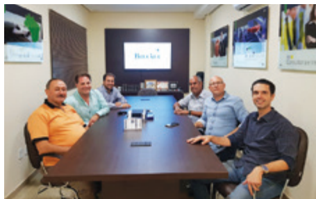
Reunião na empresa debateu o setor

Após visitarem a nova unidade, o presidente e o vice estiveram na atual sede da empresa para uma reunião com os di-