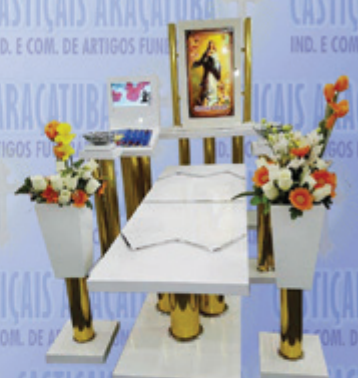
Capela Santa Fé c/ dois Monitores

Visite nosso site: www.casticaisaracatuba.com.br