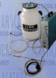
Bomba Dupla Função