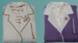
Conjunto Fem. Luxo