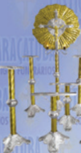
Jogo 07 Super Luxo

Visite nosso site: www.casticaisaracatuba.com.br