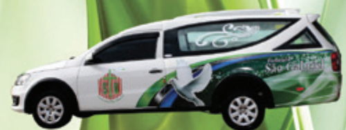
Nova Saveiro G6 VENUX