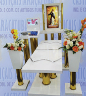
Capela Santa Fé c/ dois Monitores

Visite nosso site: www.casticaisaracatuba.com.br