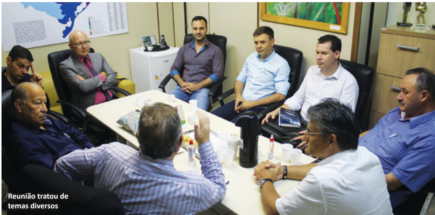
Reunião tratou de temas diversos