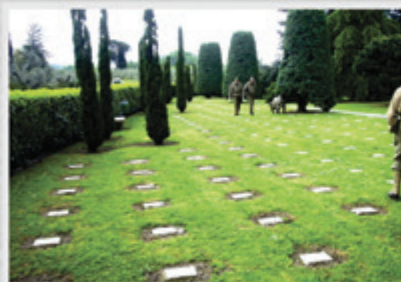
Cemitério dos pracinhas brasileiros na Itália