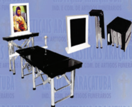
Capela Portátil c/ Monitor