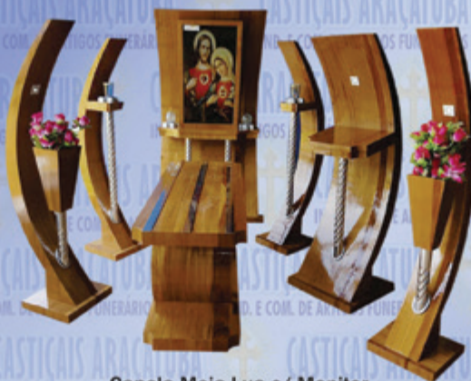
Capela Meia-Lua c/ Monitor Lançamento 2017