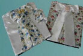
Conjunto Fem. Top