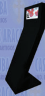
Painel Informativo c/ Monitor