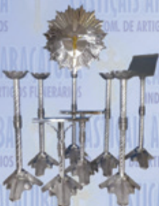
Jogo 011 Luxo