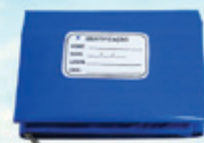
SACO PARA OSSOS