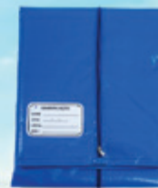
SACO PARA RESGATE