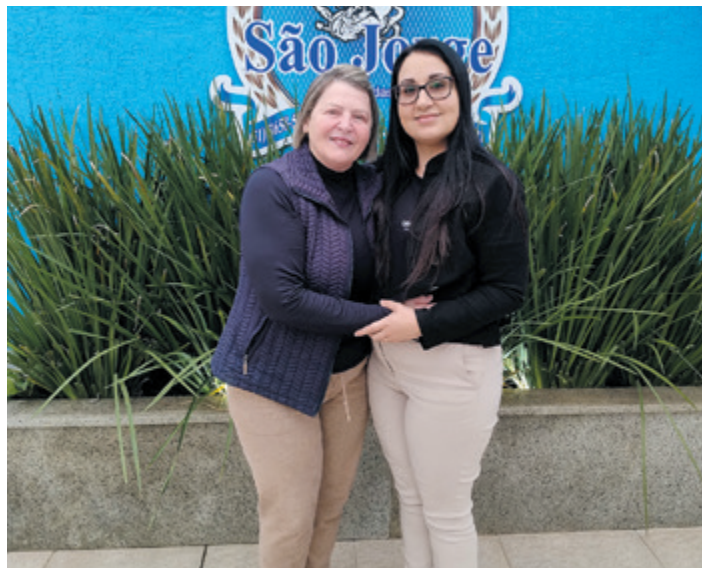
Delegada também esteve na São Jorge, de Charqueadas