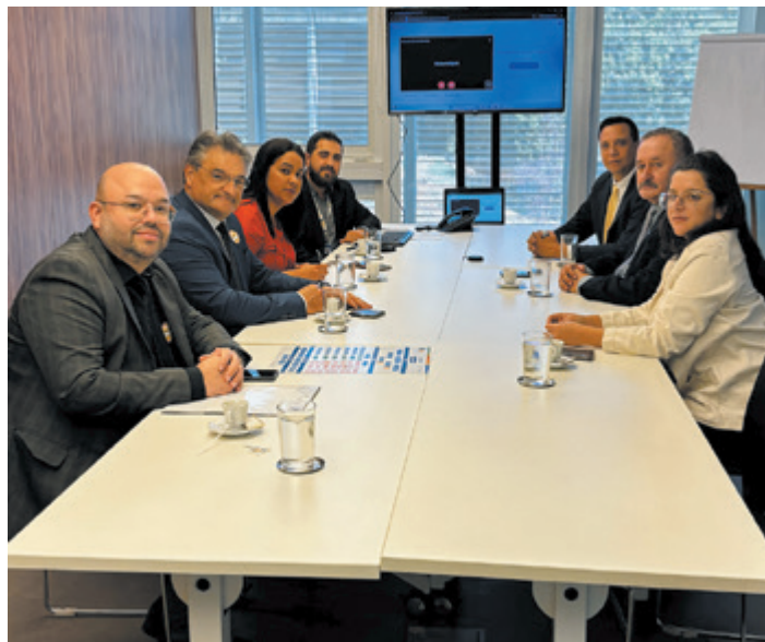
Dirigentes também foram à Confederação Nacional dos Municípios