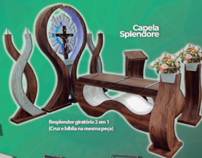
Resplendor giratório 2 em 1 (Cruz e bíblia na mesma peça)

Metalúrgica São Thiago, desde 1986 produzindo artigos funerários com a melhor matéria-prima do mercado, sempre buscando soluções exclusivas e inovadoras sem deixar a tradição de lado.