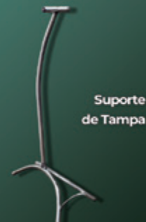
Suporte de Tampa

(18) 3659-1525 (18) 9 9776-5552 (18) 9 9786-9935