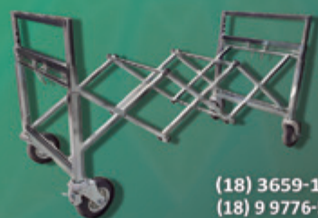
Carrinho Sanfonado com Ajuste de Altura