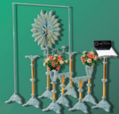
Conjunto 03 Luxo Dourado