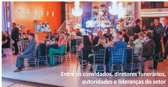
Entre os convidados, diretores funerários, autoridades e lideranças do setor