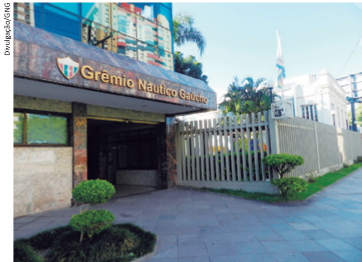
Jantar comemorativo será no Grêmio Náutico Gaúcho

cerimônias. No jantar comemorativo, a programação terá homenagem a sócio-fundador, apresentação do filme oficial alusivo aos 40 anos, DJ, entre outras atrações.