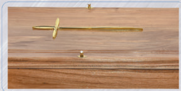
Ref. 402 - Urna Barcelona