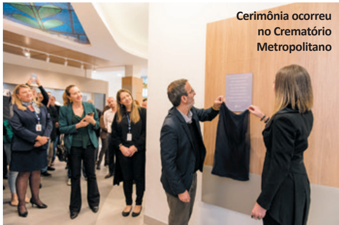
Cerimônia ocorreu no Crematório Metropolitano