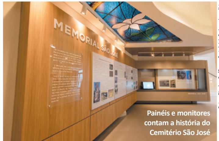
Painéis e monitores contam a história do Cemitério São José