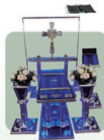
Capela de Acrílico e Alumínio com Led (Ref. 190)