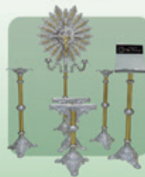
Conjunto nº 3 Luxo Dourado 6 peças (Ref. 520)