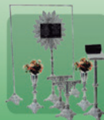
Conjunto Evangélico 7 peças (Ref. 554)