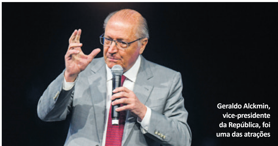
Geraldo Alckmin, vice-presidente da República, foi uma das atrações

O Sicomércio 2023 reuniu lideranças e executivos do comércio de bens, serviços e