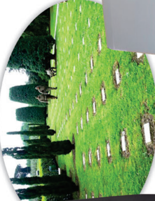
CEMITÉRIO DOS PRACINHAS BRASILEIROS | PISTÓIA - ITÁLIA

MODELO “ROTUNDUS” ESTRUTURAL RÍGIDO CIRCULAR