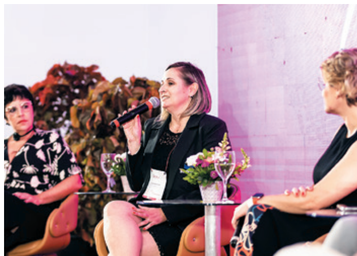
Diretora administrativa participou do painel Mulheres Empreendedoras