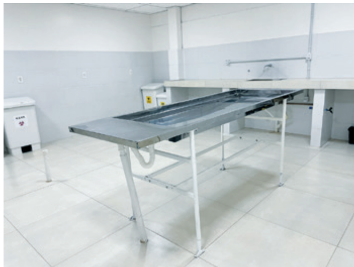
Instalações de última geração para atender as funerárias