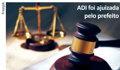
ADI foi ajuizada pelo prefeito

Para o autor da ação, a lei possui vício de origem, pois sua propositura partiu do Poder Legislativo, quando deveria ter sido levada a efeito por ato do Poder Executivo. Segundo