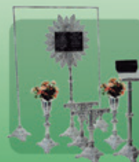
Conjunto Evangélico 7 peças (Ref. 554)