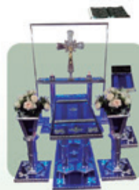
Capela de Acrílico e Alumínio com Led (Ref. 190)