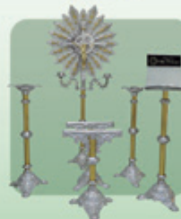
Conjunto nº 3 Luxo Dourado 6 peças (Ref. 520)