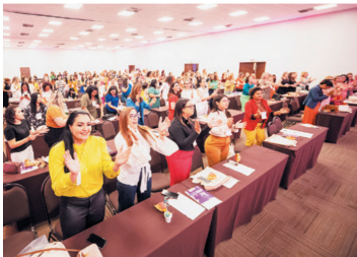
Evento teve mais de 200 mulheres inscritas. Próxima edição será em Pernambuco