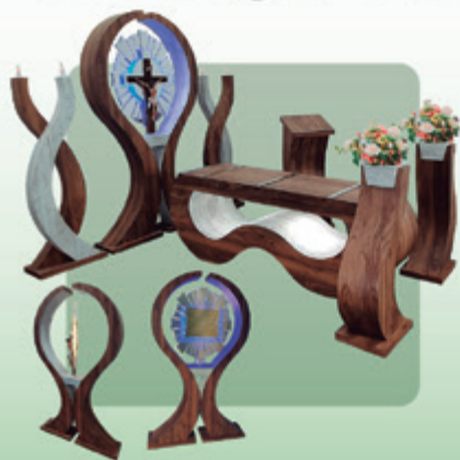
Capela Splendore (Ref. 600)