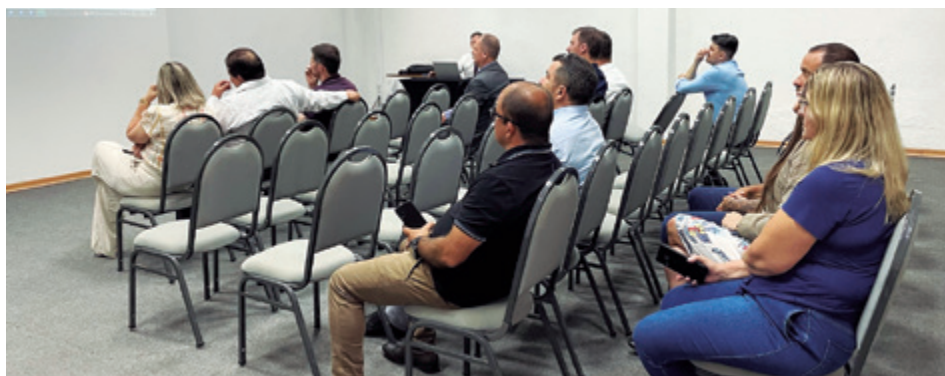
Assembleia reuniu diretores funerários de todas as regiões

Foi aprovada por unanimidade em Assembleia Geral Ordinária a previsão orçamentária de 2023. A reunião ocorreu no dia 22 de dezembro, em Porto Alegre, no salão de eventos do Açores Premium Hotel. Pela projeção, o exercício terá superávit. Outra deliberação diz respeito às contribuições associativas. Os valores foram atualizados, após