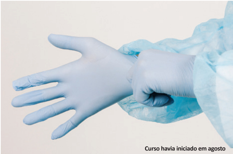
Curso havia iniciado em agosto

N ove peritos médico-legistas estão entre os 44 servidores que concluíram o curso de Formação Profissional do Instituto-Geral de Perícias (IGP).