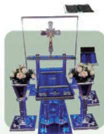
Capela de Acrílico e Alumínio com Led (Ref. 190)