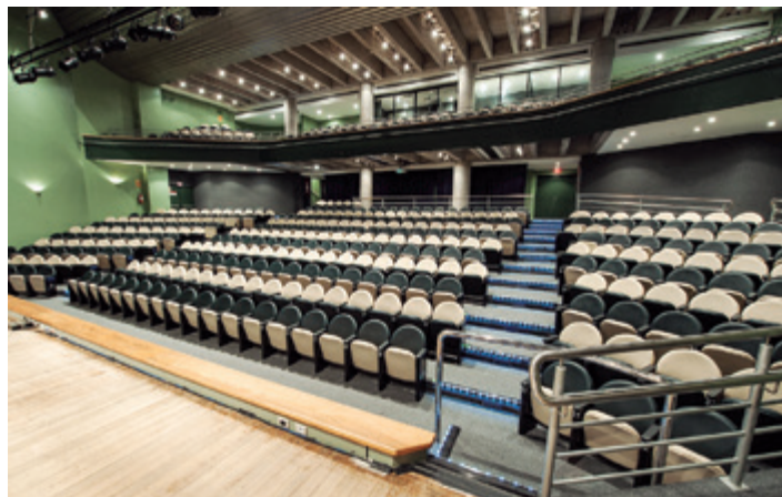
Teatro receberá ciclo de palestras

com que fosse escolhido para presidir a Comissão Organizadora. “Na primeira edição da mostra ele liderou todo o processo, com êxito. Nada mais correto do que nomeá-lo novamente. A responsabilidade e dedicação com que tem orquestrado a edição deste ano tranquiliza e, ao mesmo tempo, nos dá a certeza de que tudo vai sair como esperamos”, argumenta o presidente. A empresa Cem Cerimônia foi a escolhida para organizar. Já a montadora será a Qualittá Stands.