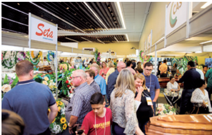
Primeira edição da mostra foi em 2017

para garantir seu espaço. Imagino que nos próximos 45, 60 dias consigamos fechar o mapa de expositores”, projeta. Para o assessor de imprensa, a nova edição da Exposesf vai ao encontro da necessidade da realização de um evento na região que estreite as relações da indústria com as funerárias. “Será uma feira para ficar na história”, prevê.