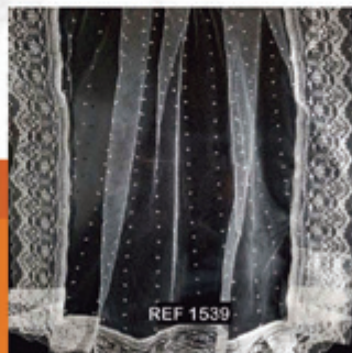
Véu Gota com Renda Especial