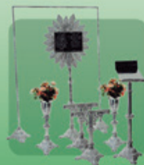
Conjunto Evangélico 7 peças (Ref. 554)