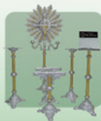
Conjunto nº 3 Luxo Dourado 6 peças (Ref. 520)