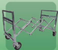
Carrinho Multiuso com ajuste de altura (Ref. 851)