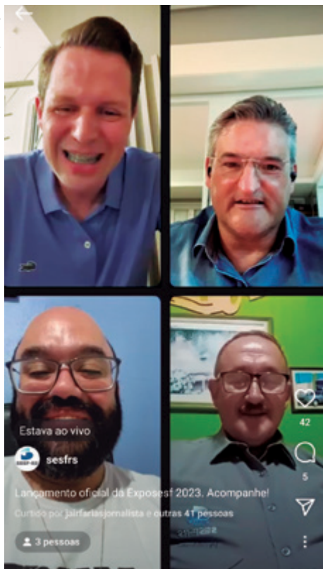
Lançamento foi em live no Instagram

O Sesf-RS confirmou em live no dia 23 de janeiro a realização da segunda edição da Exposição Nacional de Produtos e Serviços para o Setor Funerário (Exposesf). A feira acontece nos dias 13 e 14 de setembro. O local é o Centro de Eventos da PUCRS, em Porto Alegre. A venda de estandes já teve início. Até o fechamento desta