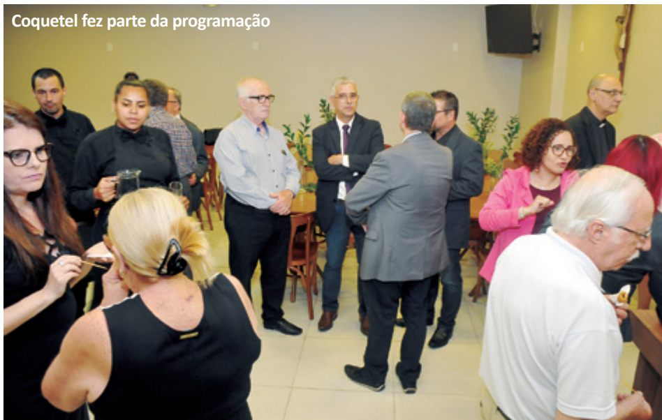
Coquetel fez parte da programação