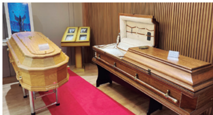
Mostruário conta com urnas luxo