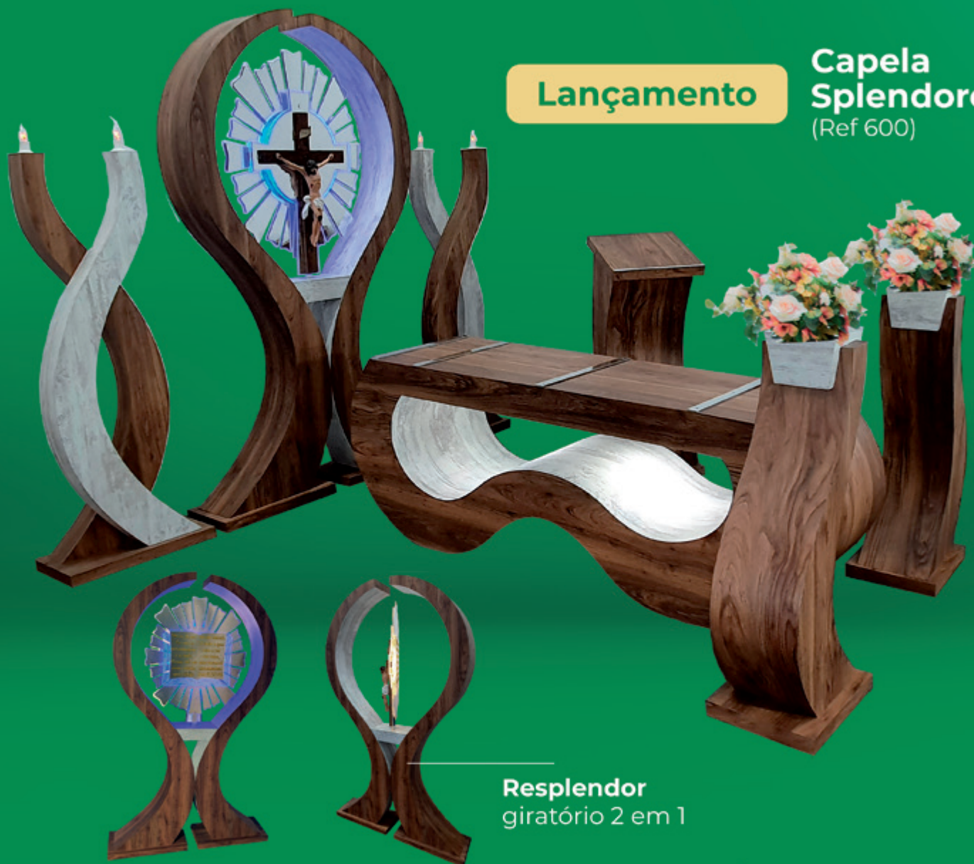
Resplendor giratório 2 em 1

Acompanhe as novidades nas nossas redes sociais