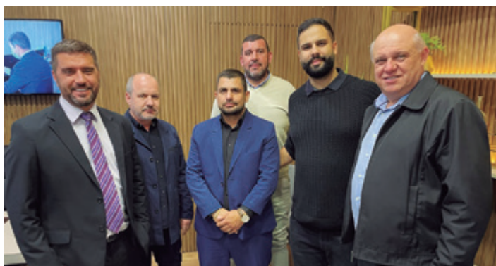
Diretores funerários e fornecedores marcaram presença

Corte da fita selou o início da operação