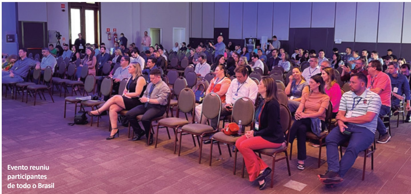
Evento reuniu participantes de todo o Brasil