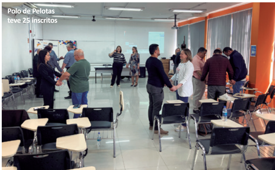
Polo de Pelotas teve 25 inscritos