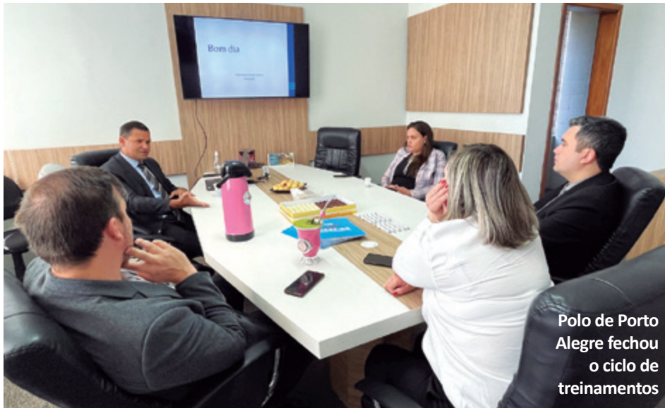
Polo de Porto Alegre fechou o ciclo de treinamentos