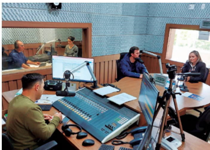
Sistema de Remoções de Corpos foi pauta de entrevista em rádio